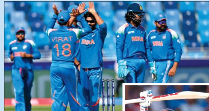
कोहली- यह पारी पाकिस्तान के खिलाफ पारी जैसी

दुबई (एजेंसी)। टीम इंडिया ने ऑस्ट्रेलिया को 4 विकेट से हराकर चैंपियंस ट्रॉफी के फाइनल में जगह बना ली है। सेमीफाइनल में प्लेयर ऑफ द मैच बने चेज मास्टर विराट कोहली, जिन्होंने 84 रन की बेहद अहम पारी खेली। दुबई के इंटरनेशनल स्टेडियम में मंगलवार को खेले गए सेमीफाइनल में कोहली ने रन चेज में 3 बड़ी साझेदारियां भी कीं। उन्होंने श्रेयस अय्यर के साथ 91, अक्षर पटेल के साथ 44 और केएल राहुल के साथ 47 रन जोड़े। इन्हीं पार्टनरशिप ने रन चेज को आसान बनाया। आखिर में हार्दिक पंड्या ने तेजी से 28 रन बनाए और केएल राहुल ने छक्का मारकर जीत दिलाई। वे 42 रन बनाकर नाबाद लौटे। ऑस्ट्रेलिया ने पहले बल्लेबाजी की और 265 रन का टारगेट दिया। ऑस्ट्रेलिया से कप्तान स्टीव स्मिथ ने 73 और एलक्स कैरी ने 61 रन बनाए। इंडियन बॉलर्स ने ऑस्ट्रेलिया को ऑलआउट कर दिया। मोहम्मद शमी ने 3, रवींद्र जडेजा और वरुण चक्रवर्ती ने 2-2 विकेट लिए।