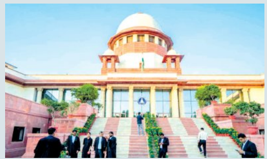
याचिकाकर्ता की बात से सहमत हैं, लेकिन इसे कैसे नियंत्रित करें? कोर्ट ने राज्य सरकारों से कहा कि वे प्राइवेट अस्पतालों को कंट्रोल करें, जो मरीजों को अस्पताल की दुकान से दवाई खरीदने के लिए मजबूर करते हैं। खासकर व दवाइयों जो

नई दिल्ली (एजेंसी)। सुप्रीम कोर्ट ने मंगलवार को कहा, राज्य सरकारें किफायती चिकित्सा और बुनियादी ढांचा देने में नाकाम रही हैं। इससे प्राइवेट अस्पतालों को बढ़ावा मिल रहा है। इसे रोकने के लिए केंद्र सरकार को ग्राइडलाइन बनानी चाहिए। दरअसल, सुप्रीम कोर्ट में एक याचिका लगाई गई थी, जिसमें कहा गया था कि प्राइवेट अस्पतालों में मरीजों और उनके परिवारों को अस्पताल की फार्मसी से महंगी दवाएं और मेडिकल इक्विपमेंट खरीदने के लिए मजबूर किया जाता है। इसलिए ऐसे अस्पतालों पर नकूल कसी जाए। इसे रोकने के लिए केंद्र और राज्य सरकारों को आदेश दिया जाए। जस्टिस सूर्यकांत और एनके सिंह की बेंच ने इस पर सुनवाई की। केंद्र सरकार ने अपने जवाब में कहा कि मरीजों को अस्पताल की फार्मसी से दवा खरीदने के लिए मजबूर नहीं किया जाता है। इस पर कोर्ट ने कहा कि यह जरूरी है कि राज्य सरकारें अपने अस्पतालों में दवाएं और मेडिकल सेवाएं सस्ती कीमतों पर उपलब्ध कराएं ताकि मरीजों को शोषण न हो। जस्टिस सूर्यकांत ने पूछ- इसे कैसे नियंत्रित करें? जस्टिस सूर्यकांत ने कहा, हम किसी और जगह सस्ते में मिल जाती हैं। कोर्ट ने केंद्र सरकार को ग्राइडलाइन बनाने को कहा, जिससे प्राइवेट अस्पताल आम लोगों का शोषण न कर सकें। इससे पहले सुप्रीम कोर्ट ने इस मामले में सभी राज्यों को नोटिस भेजा था। ओडिशा, अरुणाचल प्रदेश, छत्तीसगढ़, बिहार, तमिलनाडु, हिमाचल प्रदेश और राजस्थान समेत कई राज्यों ने जवाब दाखिल किए थे। दवाइयों की कीमतों के मुद्दे पर राज्यों ने कहा कि वे केंद्र सरकार के प्राइस कंट्रोल ऑर्डर पर निर्भर हैं।