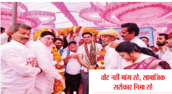
वोट नहीं मांग रहे, सामाजिक सरोकार निभा रहे

रीट परीक्षा में अभ्यर्थियों की जनेऊ उतारे जाने के सवाल पर पायलट ने कहा कि प्रदेश की भाजपा सरकार ने प्रतियोगी परीक्षाओं में नकल रोकने के लिए बड़े-बड़े दावे किए। लेकिन उस पर उन्हें पर्याप्त कामयाबी नहीं मिली। अभी भी कई विसंगतियां हैं, जिन्हें दूर किया जाना चाहिए। केंद्र सरकार कुछ लोगों को फायदा पहुंचाने पर काम कर रही है। शेरव मार्केट हो, बैंक से लोन देने का काम हो, कुछ लोगों को फायदा पहुंचाया जा रहा है। आर्थिक अपराध हो रहे हैं। जिनकी परतें अब खुल रही हैं। भाजपा नेताओं को जनता के बीच आकर उनका जवाब देना होगा। राहुल गांधी भी जेपीसी की मांग को लेकर मुद्दा उठा चुके हैं। उन्होंने कहा- प्रदेश में किसानों की फसल खरीद समय पर नहीं हो रही। कांग्रेस सरकार के समय जो जिले