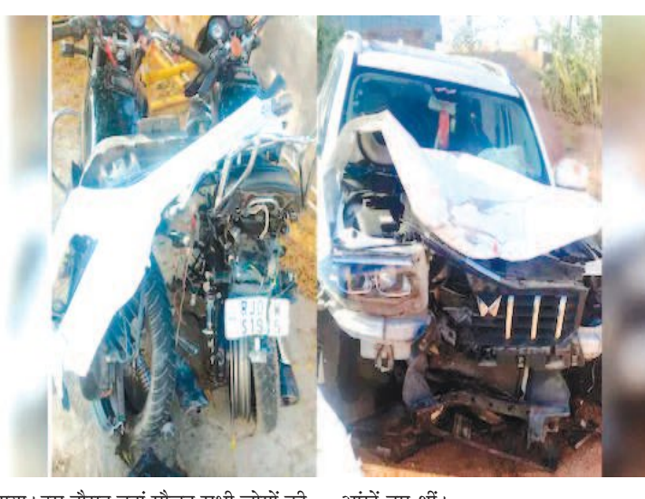
गया। इस दौरान वहां मौजूद सभी लोगों की आंखें नम थीं।

हादसे में स्कॉर्पियो और दोनों बाइक बुरी तरह डैमेज हो गई। यहां तक कि स्कॉर्पियो के पहिए तक निकल गए। बीकानेर के पीबीएम अस्पताल की मार्चयूरी के बाहर खानूवाला विधायक विश्वनाथ मेघवाल भी पहुंचे। वहां उन्होंने हादसे में जान गंवाने वाले युवकों के परिजनों से मुलाकात की। चारों का रिविवा दोपहर नाल गांव में अंतिम संस्कार किया गया। इस दौरान वहां मौजूद सभी लोगों की आंखें नम थीं।