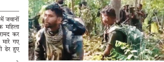
9 फरवरी को जवानों ने 31 नक्सलियों को मारा

सुकमा ( एजेंसी )। छत्तीसगढ़ के सुकमा जिले में जवानों ने 2 नक्सलियों को मार गिराया है। इनमें एक महिला और एक पुरुष नक्सली है। दोनों के शव बरामद कर लिए गए हैं, लेकिन पहचान नहीं हो पाई है। मारे गए नक्सलियों को मिलाकर 2025 में 83 नक्सली डेर हुए हैं। मामला किस्टाराम थाना क्षेत्र का है। मिली जानकारी के मुताबिक शनिवार सुबह से पुलिस और नक्सलियों के बड़े लीडर्स से मुठभेड़ चल रही है। दोनों तरफ से रुक-रुककर फायरिंग हो रही है। बताया जा रहा है कि किस्टाराम इलाके में कोबरा, छत्रन और जिला बल के करीब 500 जवानों ने नक्सलियों को घेर रखा है।