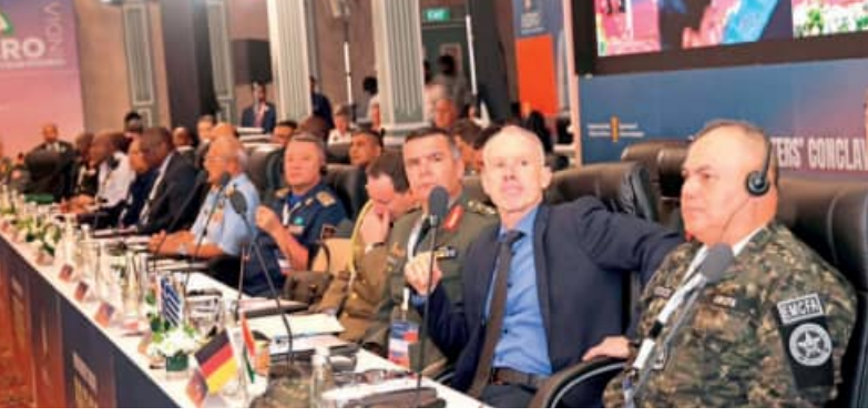
एआई और नई तकनीकों पर नजर रखना जरूरी

बैंगलुरु (एजेंसी) । बैंगलुरु में एशिया के सबसे बड़े एयरो शो एयरो इंडिया 2025 की शुरुआत हो चुकी है। रक्षा मंत्री राजनाथ सिंह ने मंगलवार को रक्षा मंत्रियों के ब्रिज कॉन्फ्रेंस में कहा कि कमजोर रहकर कोई देश कभी भी शांति नहीं ला सकता, केवल मजबूत होकर ही हम बेहतर दुनिया के लिए काम कर सकते हैं। राजनाथ ने कहा कि बाईंडर सुरक्षा और देश की आंतरिक सुरक्षा के बीच का फर्क खत्म होता जा रहा है। अब हाईब्रिड वॉरफेयर की मदद से शांतकाल में भी देश के अहम इन्फ्रास्ट्रक्चर को निशाना बनाया जा सकता है। इसलिए हमें तैयार रहने की जरूरत है। सिंह ने कहा, शांति का वक्त केवल शक्ति की जड़ों पर ही खड़ा हो सकता है। भारत ने अपनी रक्षा क्षमताओं को मजबूत करने के लिए कड़ी मेहनत की है। मुझे लगता है कि एयरो इंडिया के रूप में एक और महाकुंभ शुरू हुआ है। प्रयागराज महाकुंभ आत्म-खोज का कुंभ है, वहीं एयरो इंडिया रिसर्च का कुंभ है।