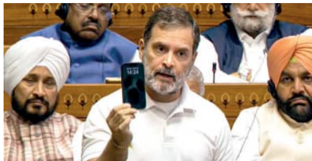
मेक इन इंडिया अच्छा आइडिया पर फेल : राहुल

नई दिल्ली ( एजेंसी ) । भाजपा के 40 सांसदों ने सोमवार को राज्यसभा अध्यक्ष से मुलाकात की है। मीडिया रिपोर्ट्स के भाजपा सोनिया गांधी के खिलाफ विशेषाधिकार हनन प्रस्ताव लाने की तैयारी में है। सोनिया के खिलाफ ये एक्शन 31 जनवरी को बजट सत्र के पहले दिन उनकी राष्ट्रपति द्रौपदी मुर्मू पर की गई टिप्पणी को लेकर है। दरअसल, मुर्मू ने दोनों सदनों को संबोधित किया था। उनके अभिभाषण पर सोनिया गांधी ने द्रौपदी मुर्मू के लिए बेचारी शब्द इस्तेमाल किया था। राहुल गांधी ने भी भाषण को बोरिंग बताया था। भाजपा ने इसे आदिवासी समाज का अपमान बताया और माफ़ी की मांग की थी। प्रधानमंत्री मोदी ने भी कहा था कि राष्ट्रपति के लिए ऐसे बयान गरीबों और आदिवासियों का अपमान है। वहीं राष्ट्रपति भवन के प्रेस सेक्रेटरी ने भी सोनिया गांधी के बयान पर आपत्ति जताई थी। उन्होंने कहा था- विपक्षी सांसदों का बयान दुर्भाग्यपूर्ण और राष्ट्रपति की गरिमा को ठेस पहुंचाने वाला है।