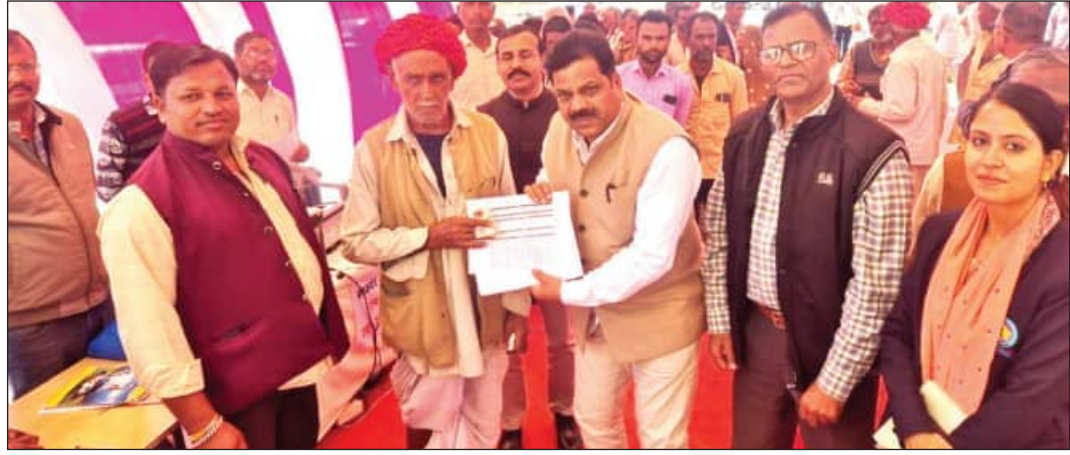
लें और सुनिश्चित करें कि हर लाभार्थी को यदि आवश्यक हो, तो शिविर को देर तक चलाया जाए ताकि कोई भी किसान पंजीकरण से वंचित ना रहे। इसी तरह नरबदखेड़ा कैम्प का भी निरीक्षण किया