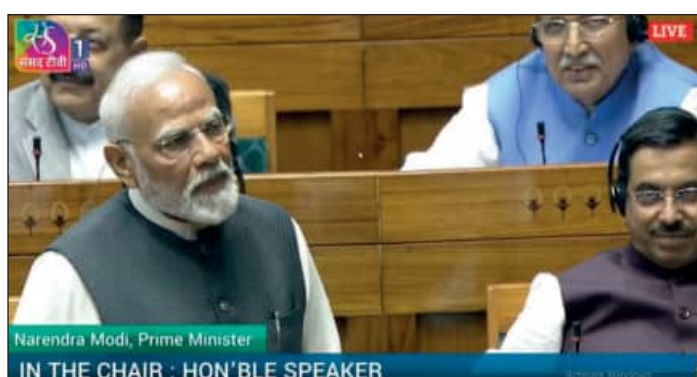
Narendra Modi, Prime Minister IN THE CHAIR - HON'BLE SPEAKER

12 हजार इलेक्ट्रिक बसों ने देश में दौड़ना शुरू कर दिया है। दिल्ली को भी ये सेवा दी गई है। बड़े शहरों में गिग इकोनॉमी बन रही है। लाखों युवा इसमें जुड़ रहे हैं। ई-श्रम पर ऐसे गिग वर्कर्स की रजिस्ट्री करवाई, उनको आईडी कार्ड मिलेगा और उन्हें आयुष्मान का लाभ दिया जाएगा। अनुमान है कि देश में करीब एक करोड़ गिग वर्कर्स हैं।