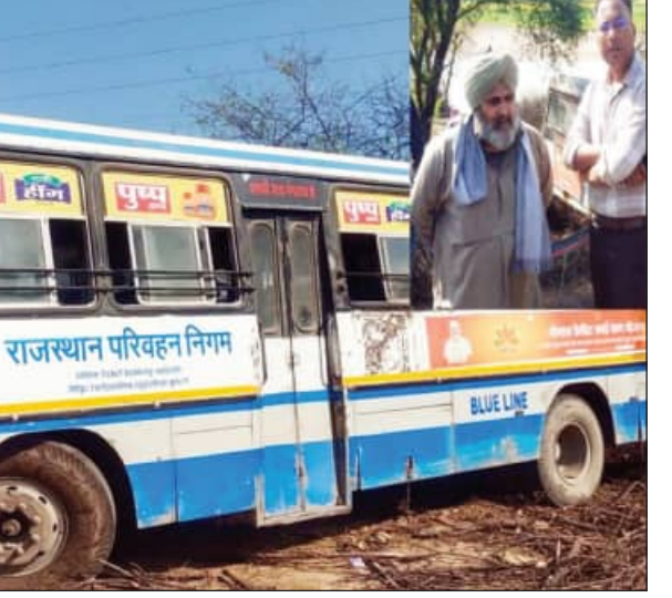
चालक के पास पहुंच कर धन्यवाद देकर चालक का हौसला बढ़ाया। इतना जरूर है कि इस घटना में एक दायित्व का मामूली चोटें आने की बात सामने आई है। जिसमें भी चोटिल यात्रियों का इलाज डिग्गी के सरकारी अस्पताल में करवाया गया।