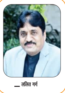
— ललित गर्ग