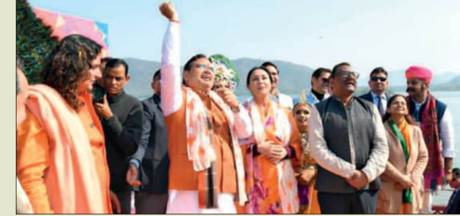
मुख्यमंत्री व उपमुख्यमंत्री ने पतंग उड़ाई

मुख्यमंत्री ने पतंग उड़ाकर मकर संक्रांति के उत्सव में सभी का उत्साहवर्धन किया। वहीं उपमुख्यमंत्री दीपा कुमारी और हवामन्तल विधायक बालमुकुंद आचार्य ने पतंग उड़ाकर उपस्थित कलाकारों और देशी विदेशी पर्यटकों के साथ पतंग उत्सव मनाया।