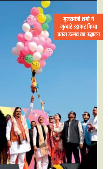
मुख्यमंत्री शर्मा ने गुब्बारे उड़कर किया पतंग उतार का उद्घाटन