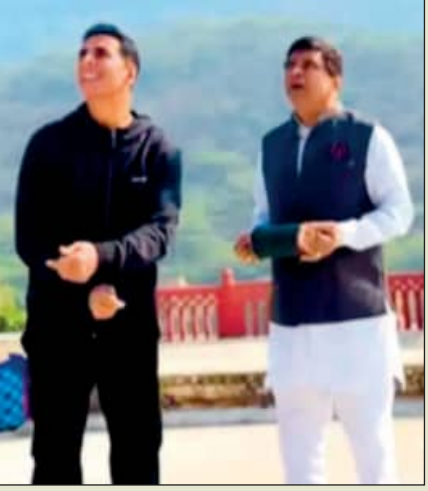
एक्टर अक्षय कुमार और परेश रावल ने जयपुर के पास सिसोदिया रानी का बाग में मंगलवार को पतंगबाजी की। परेश रावल ने चरखी थामकर खिलाड़ी कुमार का हांसला बढ़ाया।