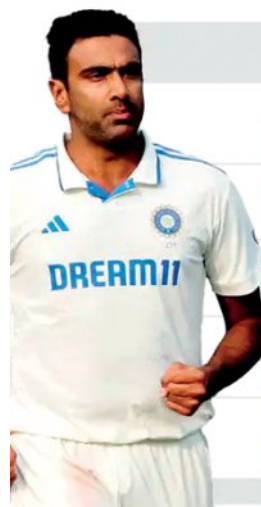
*आंकड़े तीनों फॉर्मेट के हैं