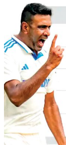
*आंकड़े तीनों फॉर्मेट के हैं