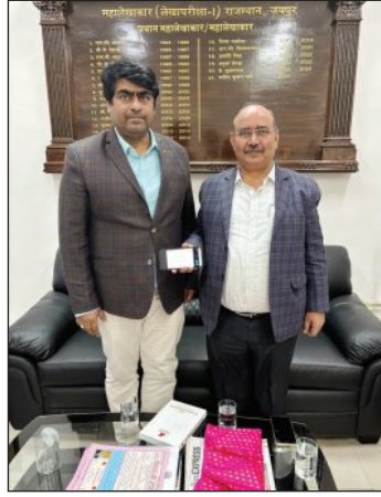
अधिक से अधिक लोगों का प्रकृति परीक्षण किया जाएगा।