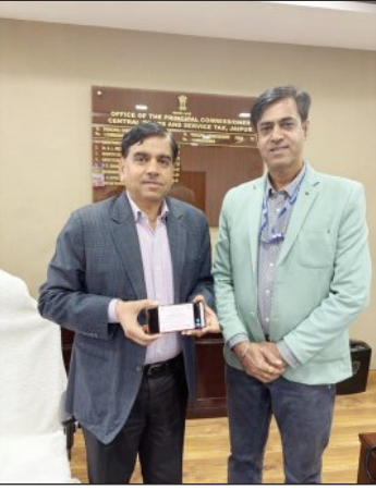
परीक्षण राष्ट्रीय आयुर्वेद संस्थान द्वारा अधिक से अधिक लोगों का प्रकृति परीक्षण किया जा चुका है और जल्द से जल्द

हमारी प्रकृति का निर्माण करने के साथ इसे प्रभावित भी करते हैं। हमारे अच्छे स्वास्थ्य के लिए हमारे शरीर की प्रकृति को जानना हम सभी के लिये बहुत जरूरी है। 25 दिसंबर तक इस अभियान के अंतर्गत सरकारी एवं निजी कार्यालय, संस्थानों पर राष्ट्रीय आयुर्वेद संस्थान के चिकित्सकों द्वारा उनका प्रगति परीक्षण करने के साथ उनके स्वास्थ्य से संबंधित सलाह भी दी जा रही है। और अब तक 70000 से ज्यादा लोगों का प्रकृति