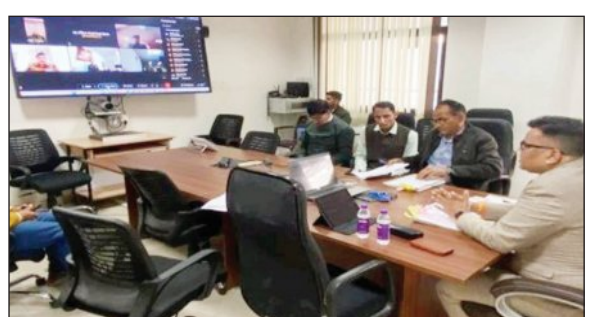
प्रभारी अधिकारियों से सामुदायिक पुलिसिंग अन्तर्गत संचालित हो रही हैं, जिनमें पुलिस मित्र, ग्राम रक्षक, स्टूडेंट पुलिस कैंडिडेट, स्वागत कक्ष, आदर्श पुलिस थाना, महिला शक्ति आत्मरक्षा कार्यक्रम प्रमुख हैं।