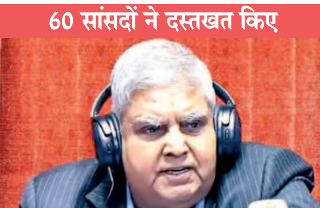
60 सांसदों ने दस्तखत किए

वहीं, मंगलवार को 11 बजे दोनों सदन की कार्यवाही शुरू हुई। लोकसभा में हंगामे के चलते पहले 12 बजे तक सदन स्थगित कर दिया गया। 12 बजे कार्यवाही शुरू होने के बाद भी अड़ानी-जॉर्ज सोरोस मुद्दे पर हंगामा जारी रहा, स्पीकर ने बुधवार तक के लिए सदन स्थगित कर दिया।