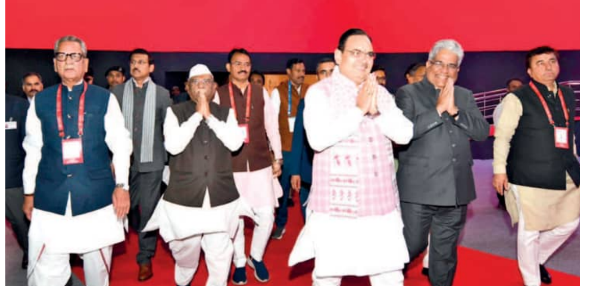
राइजिंग राजस्थान ग्लोबल इन्वेस्टमेंट समिट का दूसरा दिन