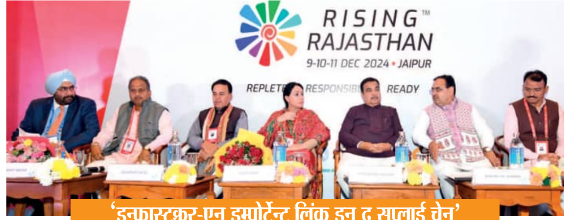
'इन्फ्रास्ट्रक्चर-एन इम्पोर्टेंट लिंक इन द सप्लाय चैन'

राइजिंग राजस्थान ग्लोबल इन्वेस्टमेंट समिट की प्रवासी राजस्थानी कॉन्वेल्व में संबोधित कर रहे थे। उन्होंने कहा कि प्रवासी राजस्थानियों ने देशभर की अर्थव्यवस्था में महती भूमिका निभाई है। अब समय राजस्थान को विकसित करने का है। राज्यपाल ने कहा कि दुध क्षेत्र में राजस्थान अग्रणी है। इस क्षेत्र में और विकास की आवश्यकता है। उन्होंने राजस्थान में निवेश करने वालों को विश्वास दिलाया कि यहां आरंभ तो राज्य सरकार हर संभव सहयोग करेगी। उन्होंने कहा कि प्रदेश में बारिश के पानी को रोके जाने पर अधिक से अधिक कार्य हो। इस समय प्रदेश में एक ही फसल ली जाती है। बारिश के पानी को सहेज कर प्रयास करें कि दो फसल यहां हो।