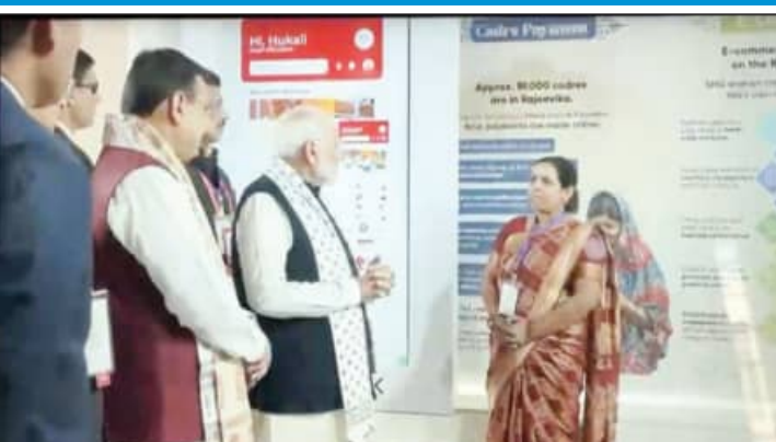
मुख्यमंत्री भजनलाल शर्मा ने कहा कि राइजिंग राजस्थान विकसित भारत और विकसित राजस्थान के सपनों को साकार करने की दिशा में मील का पत्थर साबित होगा। इस दौरान अनिल अग्रवाल, कुमार मंगलम बिड़ला सहित देश के नामचीन

युवाओं वाला देश रहने वाला है। उन्होंने कहा कि राजस्थान सरकार की पहल राइजिंग राजस्थान से निवेशकों में उत्साह है। जब राजस्थान नई ऊंचाइयों पर पहुंचेगा तो भारत को भी नई ऊंचाई मिलेगी। उन्होंने कहा कि मुख्यमंत्री भजन लाल शर्मा की सरकार ने थोड़े से समय में जोरदार काम कर दिखाया है। उन्होंने राजस्थान की उद्योग संभावनाओं की चर्चा करते हुए कहा कि भारत के खनिज भंडार का बड़ा हिस्सा राजस्थान में है। मुख्यमंत्री भजनलाल शर्मा ने कहा कि राइजिंग राजस्थान विकसित भारत और विकसित राजस्थान के सपनों को साकार करने की दिशा में मील का पत्थर साबित होगा। इस दौरान अनिल अग्रवाल, कुमार मंगलम बिड़ला सहित देश के नामचीन