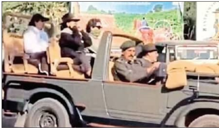
जंगल का भ्रमण किया था, लेकिन उन्हें बाघ-बाधिन के दीदार नहीं हुए थे।