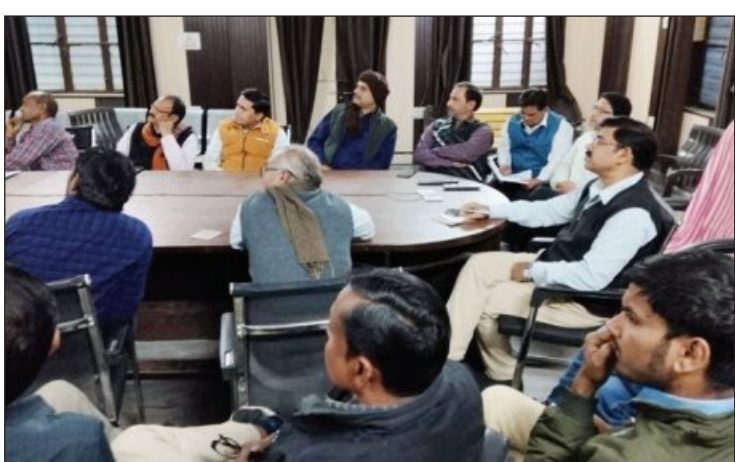
अपने नजदीकी थाने में सभी प्रश्न पत्रों को सुरक्षा के बीच रखवाएंगे। जहां से परीक्षा वाइज का वितरण किया जाएगा। वीसी के माध्यम से पंचायत समिति सभागार में आयोजित हुई परीक्षा