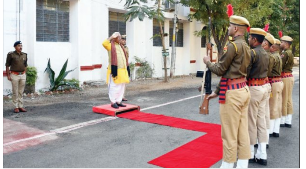
साथ उनके उत्कृष्ट कार्यों को और सभी पुलिस अधिकारियों ने गृह अधिक प्रभावशाली बनाने में राज्य मंत्री को यह भरोसा दिलाया कि जिले में कानून व्यवस्था को सहायक होगा। बैठक के अंत में कानून व्यवस्था को कायम रखा जाएगा और सभी पुलिस अधिकारी आपसी समन्वय से कार्य करेंगे।

कहा कि जिले की सुरक्षा और विकास के लिए हम सब मिलकर काम कर रहे हैं। अपराधमुक्त समाज बनाने के लिए पुलिस और जनता के बीच संवाद बढ़ाना जरूरी है। उन्होंने वर्तमान में युवा पीढ़ी में नशे की लत को लेकर चिंता जाहिर करते हुए जन जागृत और पुलिस कार्रवाई पर जोर दिया। इसके अतिरिक्त माहेश्वरी ने पुलिस प्रशासन की भूमिका को केवल कानून और व्यवस्था बनाए रखने तक सीमित न मानते हुए, इसे सामाजिक कल्याण और सामुदायिक सेवा के रूप में भी देखा। उन्होंने पुलिस के साथ आम जनता के संवाद को बढ़ावा देने और आपसी विश्वास को मजबूत करने के प्रयासों की प्रशंसा की। विधायक ने आश्वासन दिया कि जिले में सुरक्षा और संसाधनों को और बेहतर बनाने के लिए सरकार हरसंभव सहयोग करेगी। उनकी यह सराहना पुलिस टीम के मनोबल को बढ़ाने के साथ-