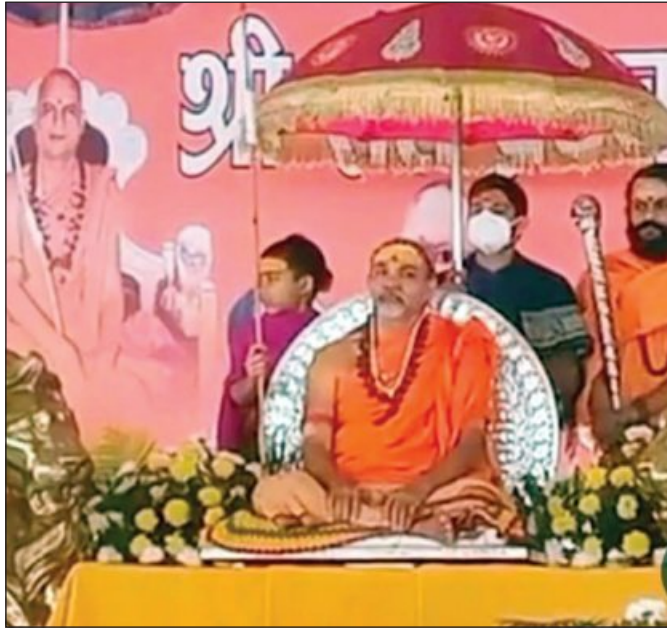
अभी बांग्लादेश से जो हिंदू आ रहे थे उन्हें मारकर भगा दिया। हम लोगों ने वीडियो देखा। हमने प्रधानमंत्री और राष्ट्रपति को पत्र लिखा कि उनको आने

इस इतिहास को मुस्लिम बच्चा पढ़ता है तो उसे भी पीड़ा होती है कि पता नहीं है तो बात सही है या गलत है। अगर सही है तो हमारे पूर्वज बड़े अत्याचारी थे। ऐसा सोचकर उसे दुख हो जाता है। अगर वह मानता है कि यह सब झूठ है तो उसका निराकरण नहीं होने की वजह से उसे दुख होता है। हम ये चाहते हैं कि जिन जिन मंदिरों और मस्जिदों के बारे में ऐसी बात है। उन सभी की सूची बनाकर इसके बारे में प्रमाण देकर निर्णय कर लेना चाहिए, क्योंकि ये बात जितने दिन तक दबी रहेगी उतनी ही समस्या बढ़ती रहेगी। इस दौरान बांग्लादेश में हिंदुओं पर हो रहे अत्याचार को लेकर शंकराचार्य ने कहा- सबसे पहले भारत देश को यह घोषणा करने की आवश्यकता है कि बेशक भारत में सभी धर्मों के लोग निवास करते हैं, लेकिन भारत हिंदुओं की धरती है। इसलिए इसे हिंदुस्तान कहा जाता है। दूसरी ये घोषणा करनी होगी कि पूरे विश्व में कहीं भी हिंदुओं के साथ कोई गलत व्यवहार होता है, तो वह निबंध रूप से भारत में आकर रह सकते हैं। इजराइल इसका उदाहरण है।