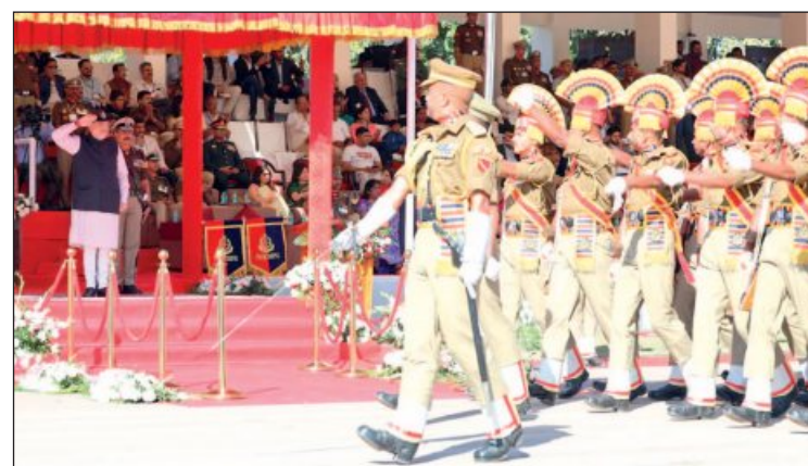
गृह मंत्री बोले- जवानों के बलिदान से ही भारत अजेय है

बढ़ता राजस्थान जोधपुर। केंद्रीय गृह मंत्री अमित शाह ने कहा कि बीएसएफ फर्स्ट लाइन ऑफ डिफेंस के नाम से जानी जाती है। यही वजह कि सीमा से जब किसी अप्रिय घटना की सूचना आती है तो गृह मंत्री को जरा भी चिंता नहीं होती। यही भरोसा रहता है कि हमारे बीएसएफ के जवान हैं, निपट लेंगे। अजेय भारत का विश्वास 140 करोड़ भारतवासियों के दिलों में पैदा हुआ है। इसका पूरा श्रेय सीमा पर खड़े हुए जवानों को जाता है और किसी का इस पर कोई अधिकार नहीं है। केंद्रीय गृह मंत्री अमित शाह रविवार को जोधपुर में सीमा सुरक्षा बल (बीएसएफ) के 60वें स्थापना दिवस (राइजिंग डे) परेड में शामिल हुए। उनके सामने जवानों, थान टीम ने एक से बढ़कर एक करतब दिखाए। इससे पहले गृह मंत्री को सुबह ठीक 11 बजे बीएसएफ की जीप में एसटीसी स्थित परेड ग्राउंड के मुख्य मंच तक लाया गया। उन्होंने परेड का निरीक्षण किया। परेड से पहले बीएसएफ विंग के स्वदेशी हेलिकॉप्टर ध्वज ने आसमान से सुरक्षा का जायजा लिया। उधर, बीएसएफ का कार्यक्रम पूरा होने के बाद गृह मंत्री अमित शाह सिकंदर हाउस जोधपुर में सरदार वल्लभ भाई पटेल की मूर्ति का अनावरण करने पहुंचे।