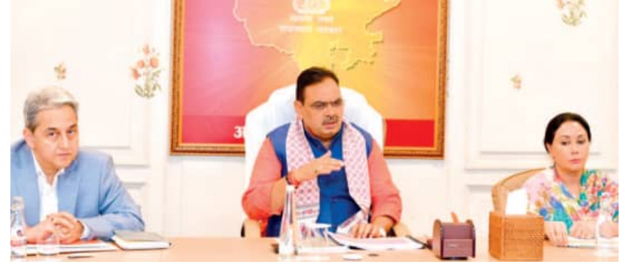
लाडो प्रोत्साहन योजना से मिल रहा बालिकाओं को संबल

रेवे पोषण आहार की निरन्तर समीक्षा करते हुए आवश्यक सुधार किए जाएं। उन्होंने विभाग के अधिकारियों को वार्षिक कैलेण्डर बनाकर आंगनबाड़ी केन्द्रों का सघन निरीक्षण करने और आवश्यक व्यवस्थाएँ दुरुस्त करने के लिए निर्देश दिए।