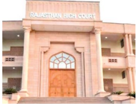
स्थानीय प्रशासन पर उठे सवाल

सीएम ने ली सड़क सुरक्षा के लिए बैठक इस घटना को लेकर राज्य और केंद्र सरकार पर सुरक्षा उपायों की समीक्षा का दबाव बढ़ गया है। जयपुर पुलिस कमिश्नर ने हादसे की गहराई से जांच के लिए एसआई टी का गठन किया है। वहीं, सीएम भजनलाल शर्मा ने भी सड़क सुरक्षा, यातायात व्यवस्था एवं दुर्घटना नियंत्रण के लिए शनिवार को मुख्यमंत्री निवास पर अधिकारियों के साथ बैठक ली है। इस दौरान सीएम ने अधिकारियों को सभी जिलों में विशेष सड़क सुरक्षा अभियान चलाते हुए ब्लैक स्पॉट्स के चिह्निकरण एवं उनके समुचित निवारण हेतु विशेष निर्देश प्रदान किए। साथ ही सड़क निर्माण और मरम्मत के कार्यों में निर्धारित मानकों का कड़ाई से पालन सुनिश्चित करने तथा सभी जिलों में परिवहन विभाग के उड़नदस्तों का गठन करके अनफिट एवं बिना परमिट के वाहनों, ओवरलोडेड वाहनों के खिलाफ सघन कार्यवाही करने के भी निर्देश दिए हैं।