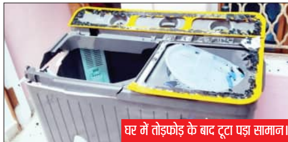
घर में तोड़फोड़ के बाद टूटा पूजा सामान।