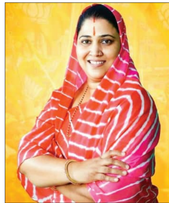
कानून व्यवस्था की बिगड़ती स्थिति को लेकर जन आंदोलन जैसे हालात पैदा हों उससे पहले वे उच्च अधिकारियों को निर्देश देकर हालात को सामान्य बनाने और आमजन की पुलिस से जुड़ी परेशानियों का समाधान कराया जाना जरूरी है।

आक्रोश जन आंदोलन के रूप में सड़कों पर दिखाई देगा। क्षेत्र के चुने हुए जनप्रतिनिधि होने के नाते आम जनता के साथ उनकी आवाज और आंदोलन में साथ देना उनकी नैतिक जिम्मेदारी होगी। विधायक ने पत्र में सीएम से कहा है कि विधानसभा क्षेत्र में