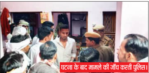
घटना के बाद मामले की जांच करती पुलिस।

घर में अकेली महिला ने किया विरोध तो उसकी भी मारपीट, पुरानी रंजिश के चलते हमला, सूचना पर पहुंची कोतवाली पुलिस कर रही मामले की जांच