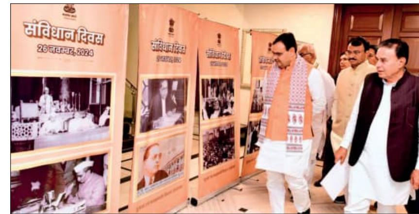
प्रधानमंत्री ने की संविधान दिवस मनाने की अभिनव पहल

मुख्यमंत्री ने कहा कि राज्य सरकार द्वारा संविधान दिवस के संदेश को प्रदेशवासियों तक पहुंचाने के लिए अनेक पहल की जा रही हैं। हम संविधान में निहित मौलिक कर्तव्यों की पालना के बेहतर प्रयासों को सम्मानित कर रहे हैं। उन्होंने कहा कि संविधान दिवस पर अनुसूचित जाति, जनजाति और अन्य पिछड़ा वर्ग के कल्याण के लिए संचालित योजनाओं का अधिकतम लाभ पहुंचाने के लिए अभियान चलाने जैसे प्रयास राज्य सरकार द्वारा किए जा रहे हैं। साथ ही, ग्रामीण एवं शहरी क्षेत्र में विद्यालयों एवं सरकारी कार्यालयों में संविधान की प्रस्तावना के पठन सहित विभिन्न कार्यक्रम और प्रतियोगिताएं भी आयोजित की जा रही हैं।