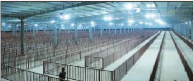
कतार के माध्यम से दर्शन व्यवस्था