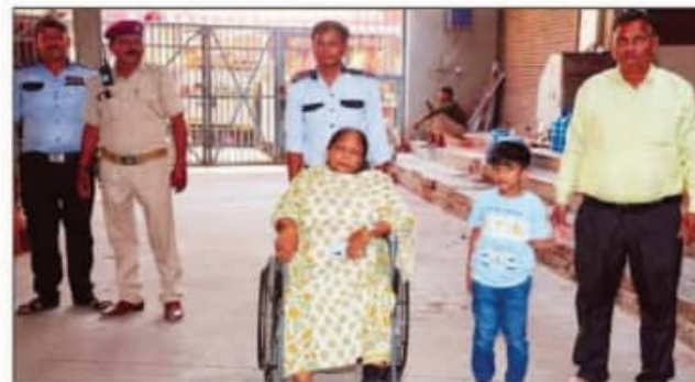
विशेषज्ञ के लिए दर्शन की व्यवस्था।