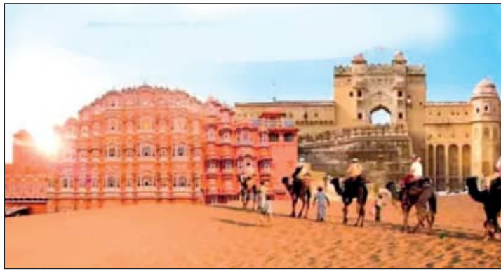
रात के तापमान में भी गिरावट

राजस्थान में अब दिन में गर्मी कम होने लगी है। रविवार को भी अलवर, पिलानी, सीकर, फलोदी, चूरू, गंगानगर, टोंक, अजमेर समेत अन्य शहरों में अधिकतम तापमान में 2 डिग्री सेल्सियस तक की गिरावट दर्ज हुई। सबसे अधिक तापमान जैसलमेर में 36.8 डिग्री सेल्सियस दर्ज हुआ। बाड़मेर में अधिकतम तापमान 36.6, जालौर में 35.7 और जोधपुर में 35.8 डिग्री सेल्सियस तापमान दर्ज हुआ। राज्य के शेष सभी शहरों में अधिकतम तापमान 35 डिग्री सेल्सियस से नीचे रहा।