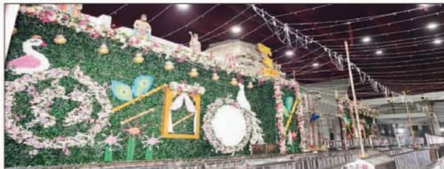
श्याम मंदिर की भव्य सजावट