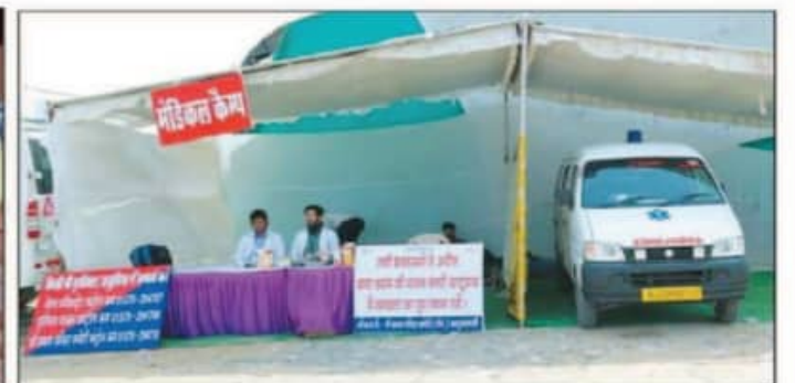
चिकित्सा व्यवस्था के लिए मेडिकल कैम्प व रोगी वाहन