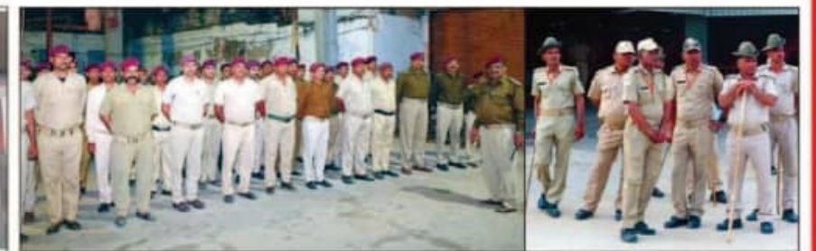
मूलभूत दर्शन हेतु सुरक्षा गार्ड व होमगार्ड व्यवस्था।