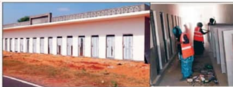
संपूर्ण मिला प्लांट में सफाई व्यवस्था व सुविधाएं