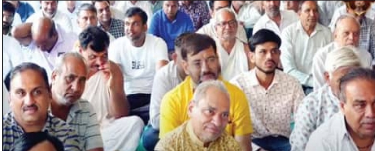
कुन्हाडी जैन मंदिर के पक्ष में फैसले जैन समाज में हर्ष की लहर