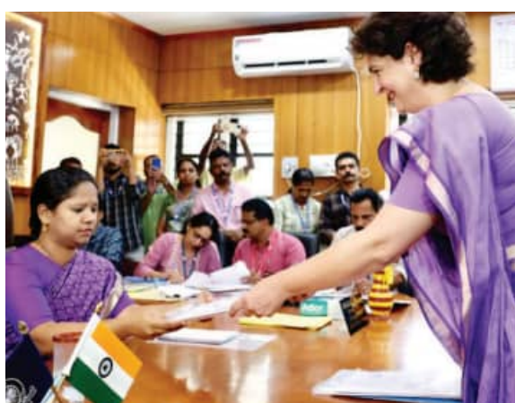
ऐसा क्षेत्र है जहां से 2 सांसद हैं। एक आधिकारिक सांसद और दूसरा अनौपचारिक सांसद। दोनों वायनाड के लिए काम करेंगे।

नई दिल्ली। कांग्रेस महासचिव प्रियंका गांधी वाड्रा ने रोड शो के बाद वायनाड लोकसभा सीट से नामांकन दाखिल कर दिया है। इस दौरान उनके साथ भाई राहुल गांधी, मां सोनिया गांधी और कांग्रेस अध्यक्ष मल्लिकार्जुन खड़गे भी मौजूद रहे। प्रियंका ने नामांकन से पहले कहा- जब मैं 17 साल की थी, तब मैंने पहली बार पिता के लिए 1989 में कैम्पेन किया था। तब से इन 35 साल के दौरान मां, भाई के लिए वोट मांगीं। अब पहली बार खुद के लिए समर्थन मांग रही हूँ। राहुल गांधी ने कहा कि वायनाड देश का