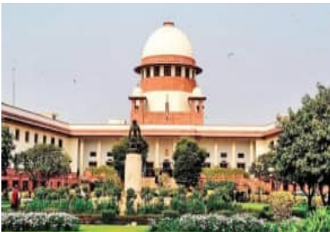
कम से कम एक मुकदमा तो चलना ही चाहिए। सुप्रीम