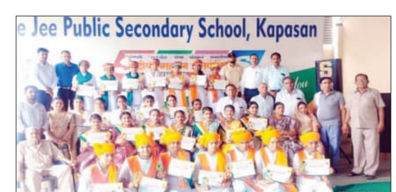
कपासन (नि.स.)। भारत विकास परिषद द्वारा रविवार को नगर के श्रीजी पब्लिक स्कूल में राष्ट्रीय समूहगान प्रतियोगिता का आयोजन किया गया।

कपासन (नि.स.) । भारत विकास परिषद द्वारा रविवार को नगर के श्रीजी पब्लिक स्कूल में राष्ट्रीय समूहगान प्रतियोगिता का आयोजन किया गया।