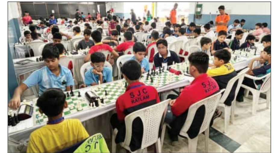
एन्जिल हाई स्कूल ग्वालियर ने विद्या भवन पब्लिक स्कूल फतहपुरा उदयपुर को 3-1 से, न्यू एरा सी.से. स्कूल गुंजरात ने राधिका एज्युकेशन स्कूल गुजरात को 3-1 से, द विट्स स्कूल सतना मध्यप्रदेश ने श्रीदेवी भागीरथ राठी माहेश्वरी विद्या को 3-1 से, इन्दौर पब्लिक स्कूल इन्दौर ने जिक विद्यालय जिक कोलोनी हरड़ा भीलवाड़ा को 3-1 से, रलोबल डिस्कवरी गुजरात माहेश्वरी पब्लिक स्कूल अमजेर को 3-1 से, हिल्स हाई स्कूल को वेसू सुरत ने लकी इन्टरनेशनल जोधपुर को 3-1 से हराया, जबकि मानव केन्द्र ज्ञान मन्दिर स्कूल गुजरात को 2 अंको बाय मिला। नीरजा मोदी स्कूल जयपुर व सेंट गेब्रियाल हायर सें. स्कूल मध्यप्रदेश के बीच मुकाबला 2-2 से बराबर

रहा। दिल्ली पब्लिक स्कूल महाराणा मेवाड़ विद्या मन्दिर उदयपुर को 3-1 से, कारमेल कॉन्वेंट स्कूल भोपाल ने विद्या भवन पब्लिक स्कूल फतहपुरा को 4-0 से, सेंट एन्थोनी सी.से. स्कूल ने श्रीदेवी भागीरथ राठी माहेश्वरी विद्या को 4-0 से, हिल्स हाई स्कूल वेसू सुरत ने ब्राइट लैण्ड्स गर्ल्स सी.से. स्कूल जयपुर को 3-1 से अंक से हराया।