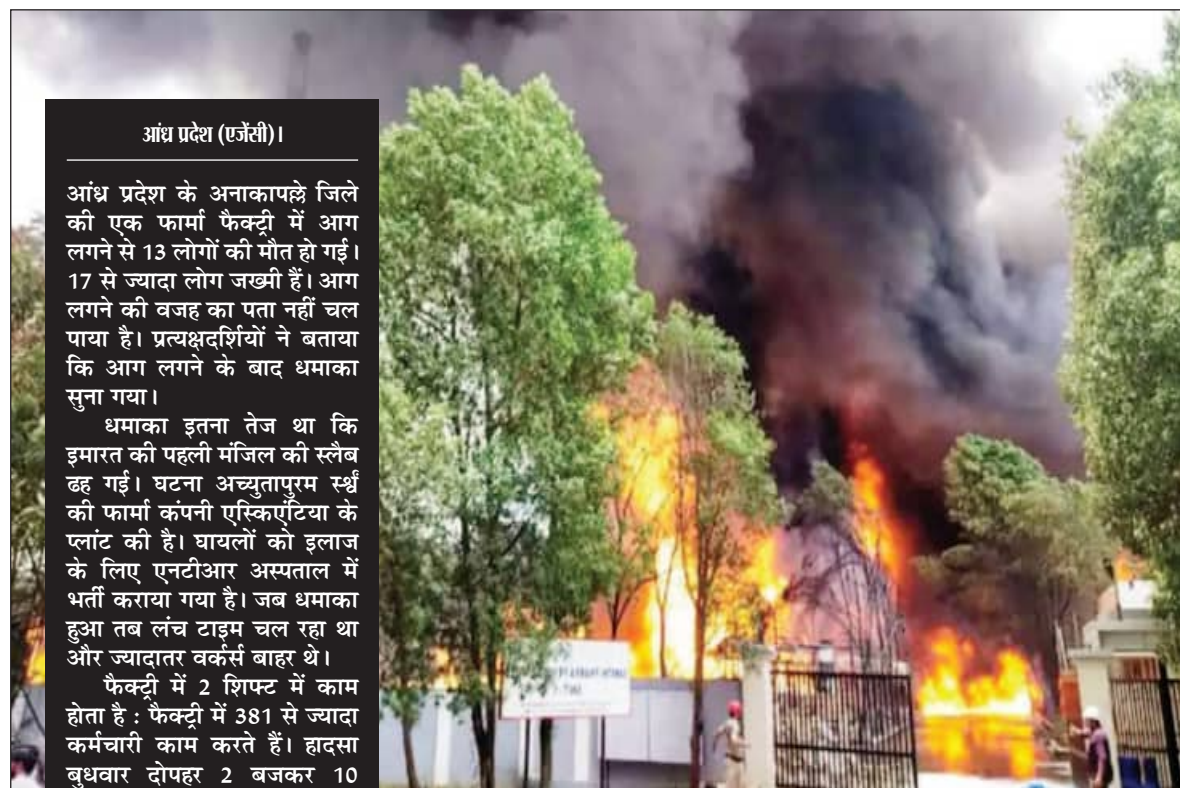
आंध्र प्रदेश (एजेंसी)।

आंध्र प्रदेश के अनाकापल्ले जिले की एक फार्मा फैक्ट्री में आग लगने से 13 लोगों की मौत हो गई। 17 से ज्यादा लोग जखमी हैं। आग लगने की वजह का पता नहीं चल पाया है। प्रत्यक्षदर्शियों ने बताया कि आग लगने के बाद धमाका सुना गया।