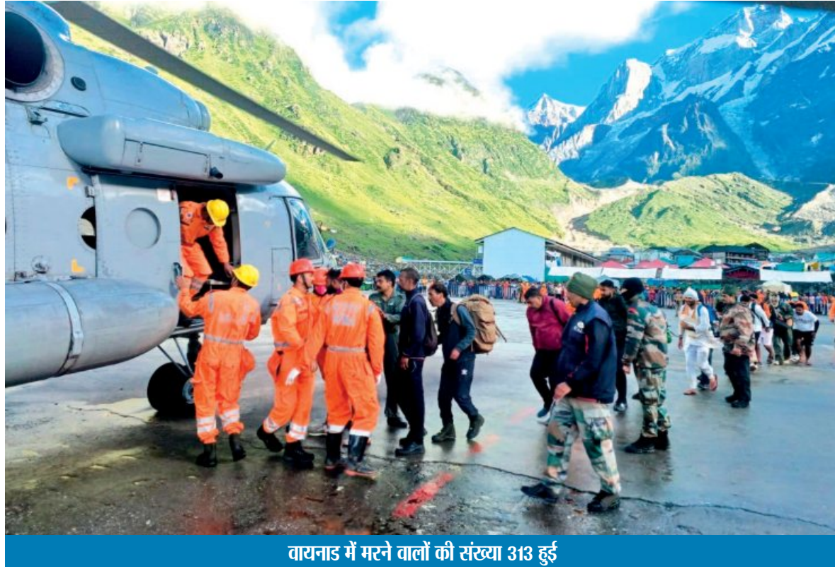
वायनाड में मरने वालों की संख्या 313 हुई

1 अगस्त को हिमाचल में 5 जगह बाढ़ फटने से 53 लापता हो गए। इनमें से 5 के शव बरामद कर दिए गए, जबकि 48 लोग अभी लापता हैं। उनकी तलाश में एनडीआरएफ, एसडीआरएफ, पुलिस और होंग गार्ड जवान सर्व अपरेशन चलाए हुए हैं।