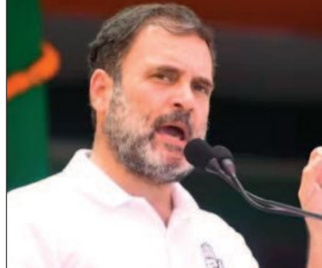
राहुल के दावे पर क्या बोले इंडिया ब्लॉक के नेता...