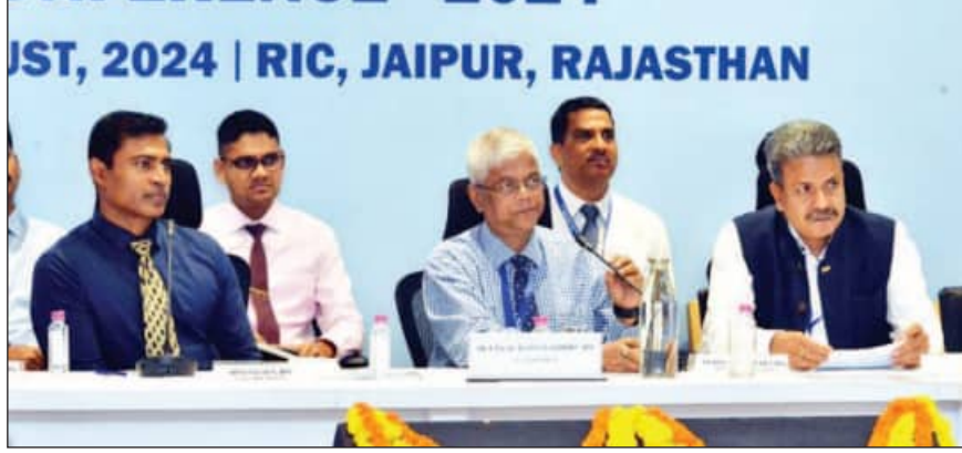
IST, 2024 | RIC, JAIPUR, RAJASTHAN