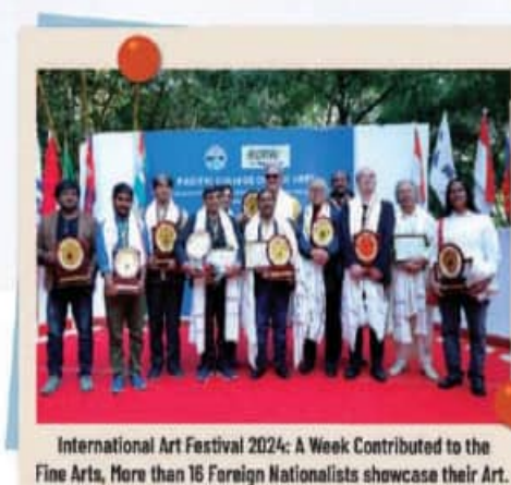
International Art Festival 2024: A Week Contributed to the Fine Arts, More than 16 Foreign Nationalists showcase their Art.