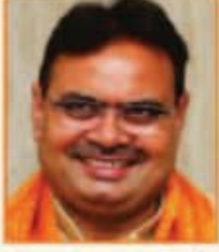
श्री भजनलाल शर्मा मुद्रयंत्री राजस्थान सरकार