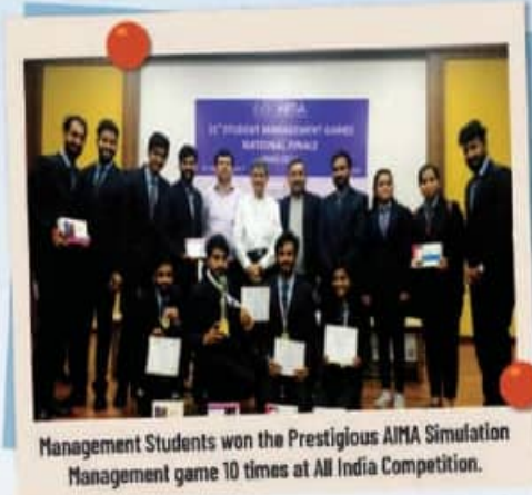
Management Students won the Prestigious AIMA Simulation Management game 10 times at All India Competition.