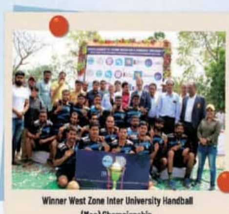
Winner West Zone Inter University Handball (Men) Championship.