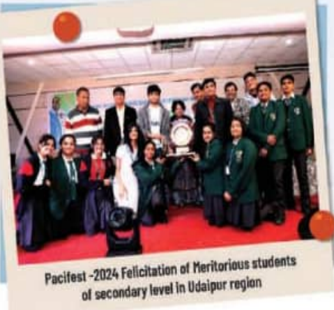
Pacifest -2024 Felicitation of Meritorious students of secondary level in Udaipur region.