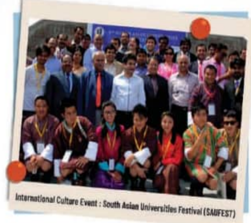
International Culture Event : South Asian Universities Festival (SAUFEST)