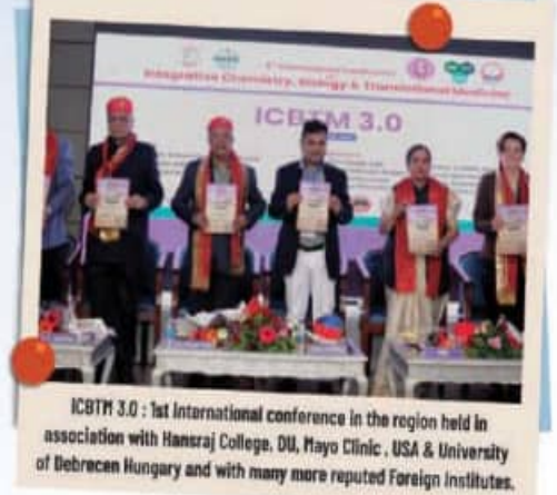
ICBM 3.0 - 1st International conference in the region held in association with Hansraj College, DU, Mayo Clinic, USA & University of Debrecen Hungary and with many more reputed Foreign Institutes.