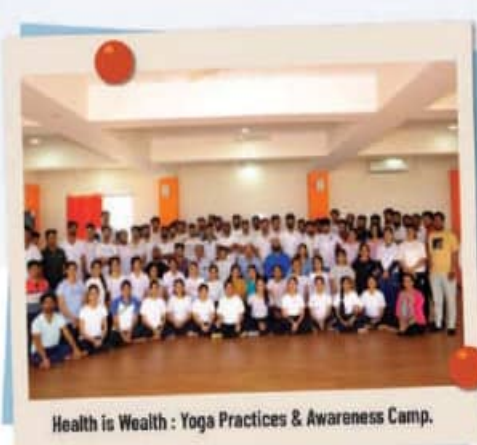
Health is Wealth : Yoga Practices & Awareness Camp.