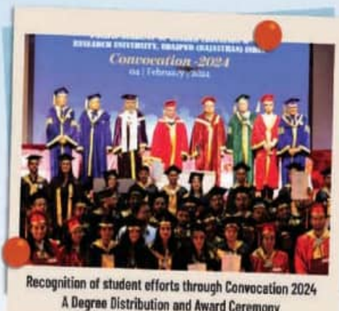
Recognition of student efforts through Convocation 2024 A Degree Distribution and Award Ceremony