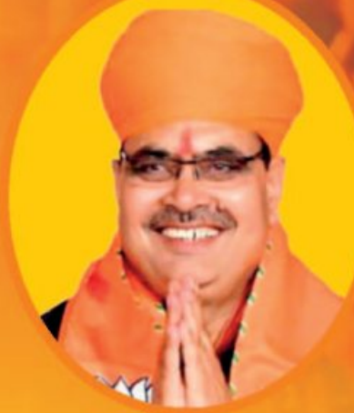
श्री भजनलाल शर्मा मुख्यमंत्री