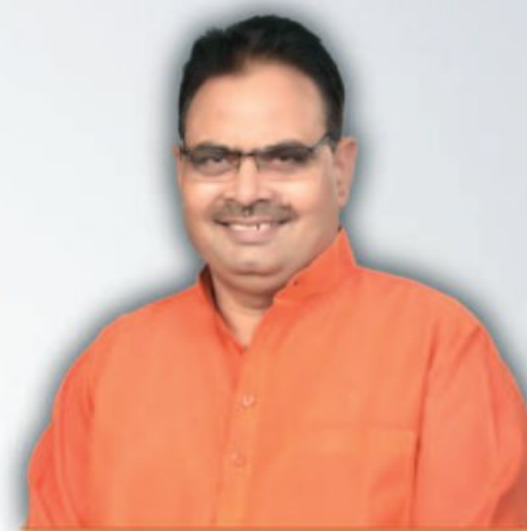
श्री भजनलाल शर्मा, मुख्यमंत्री

समृद्ध किसान - खुशहाल राजस्थान राजस्थान सरकार की ऐतिहासिक पहल