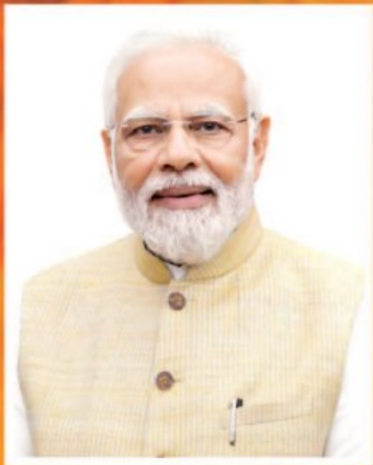
श्री नरेन्द्र मोदी, प्रधानमंत्री