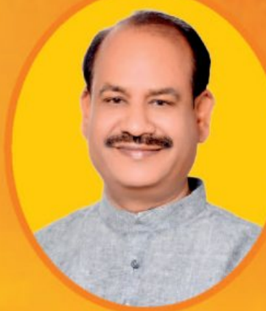
श्री ओम बिरला लोकसभा स्पीकर