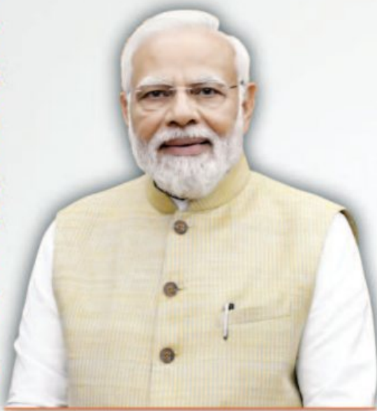
श्री नरेंद्र मोदी, प्रधानमंत्री