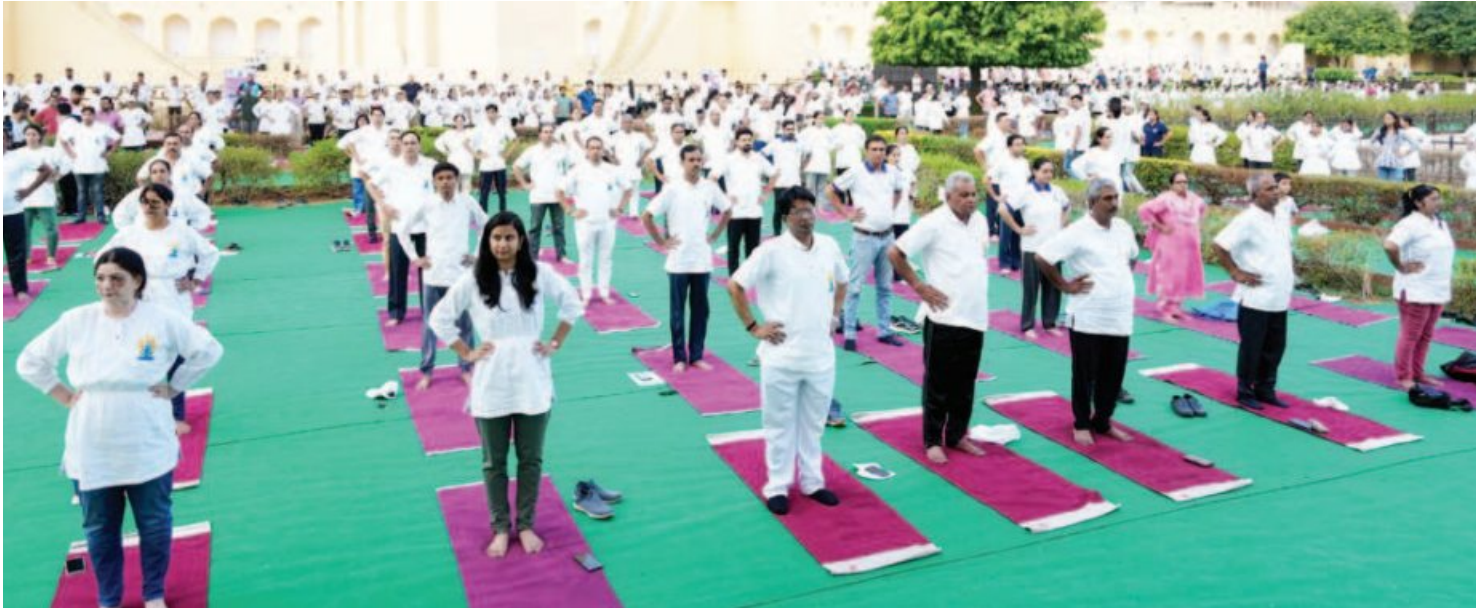
जयपुर के जंतर मंतर में योग अभ्यास कार्यक्रम